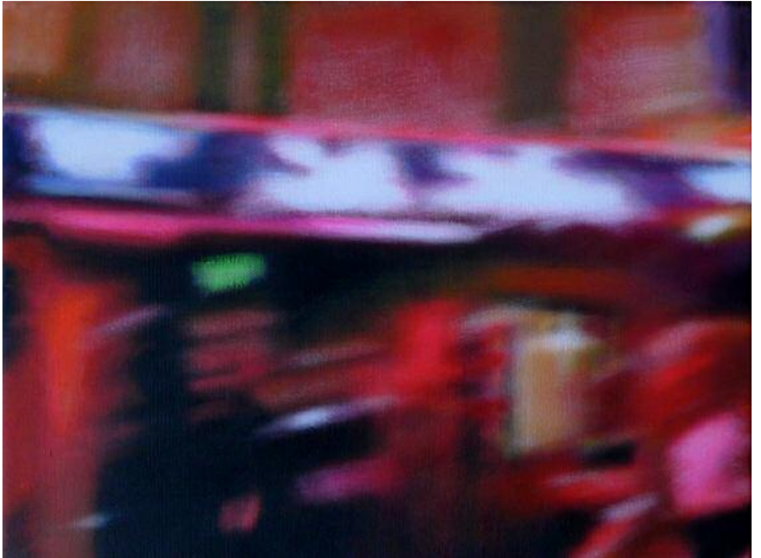
Fuzzy , novembre 2015 Acrylique sur toile, 27 x 35 cm