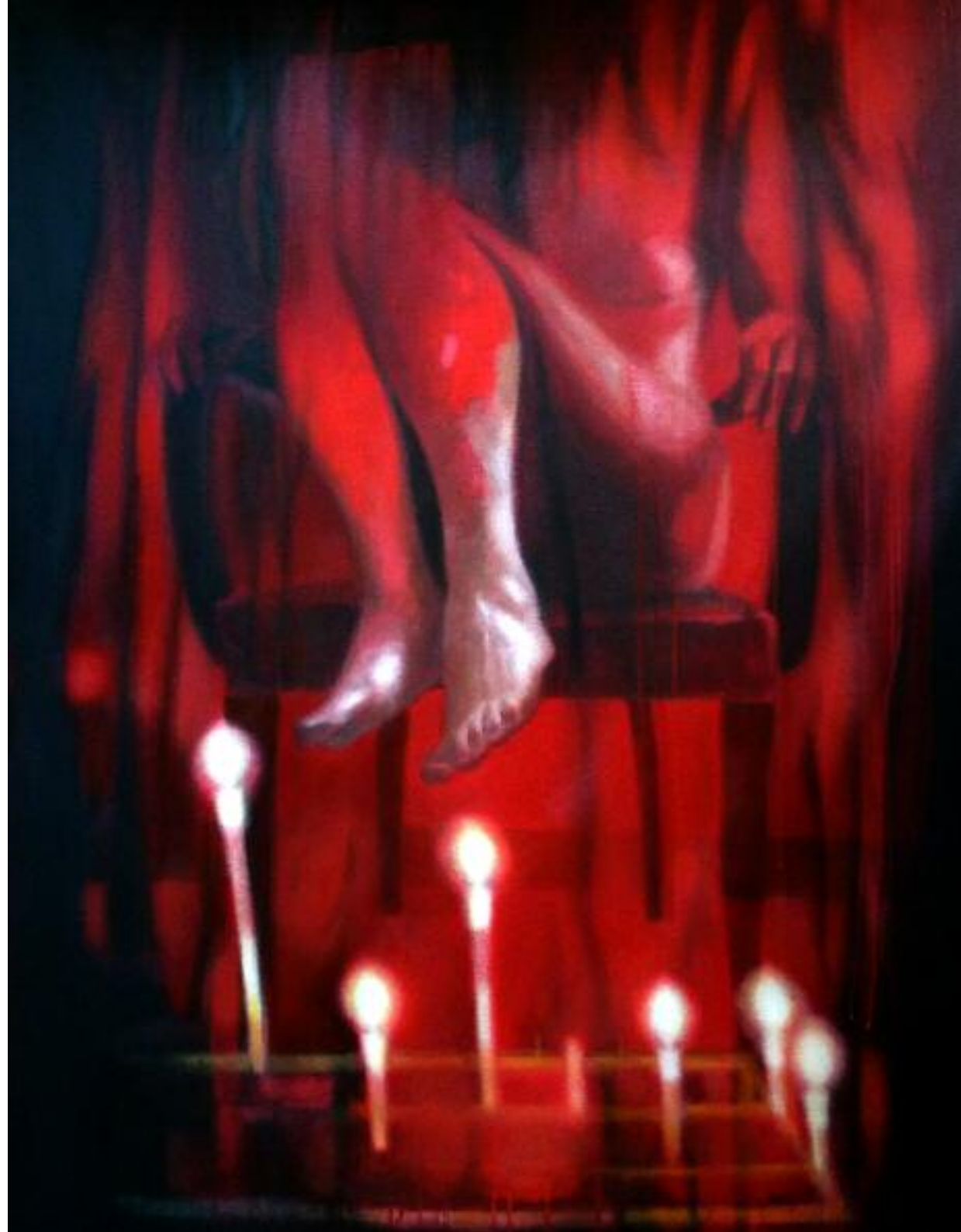
The Soundtrack Of Your Fears, février 2014 Acrylique sur toile, 110 x 80 cm