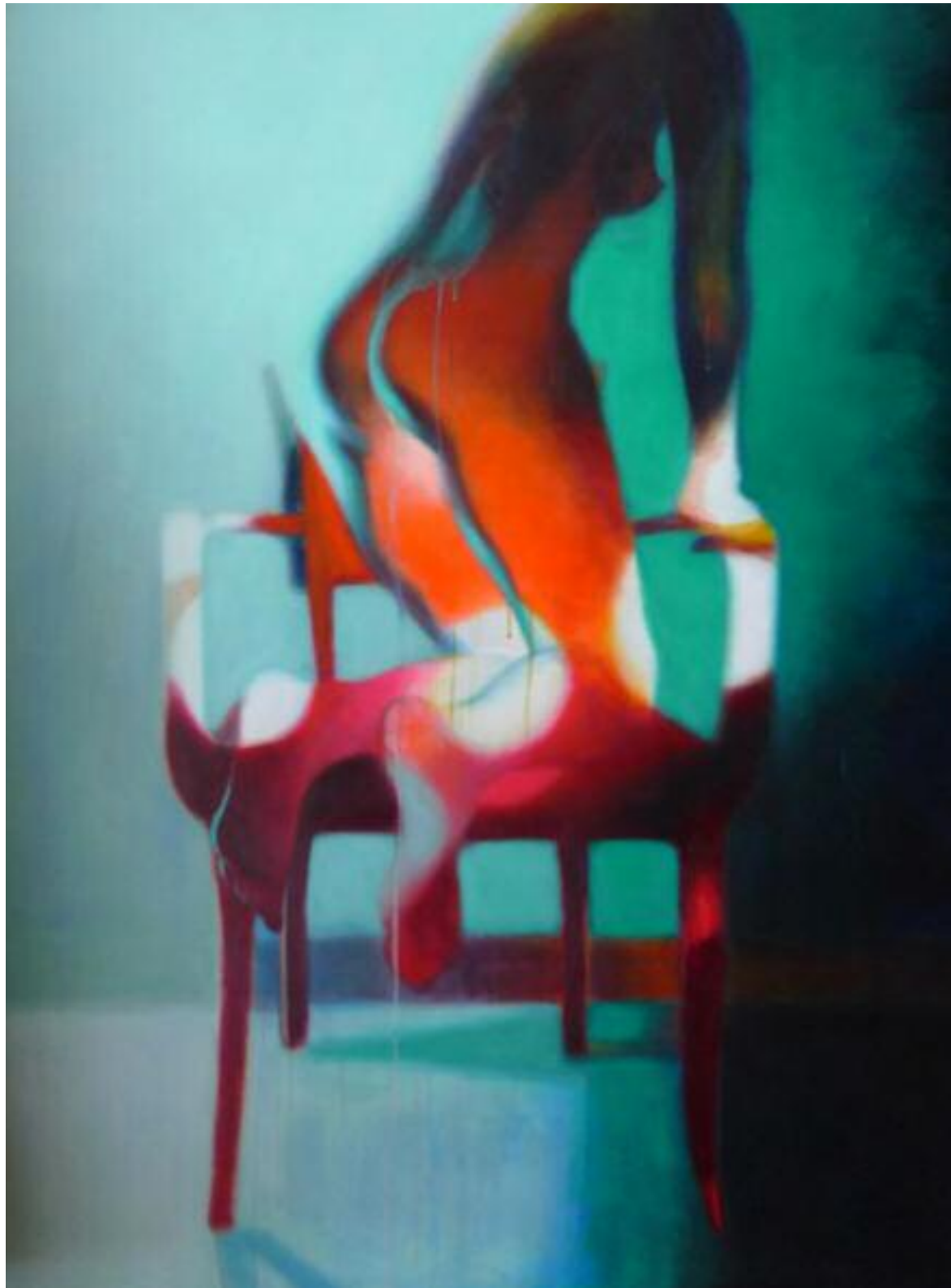
Devil In Disguise, mars 2015 Acrylique sur toile, 116 x 89 cm