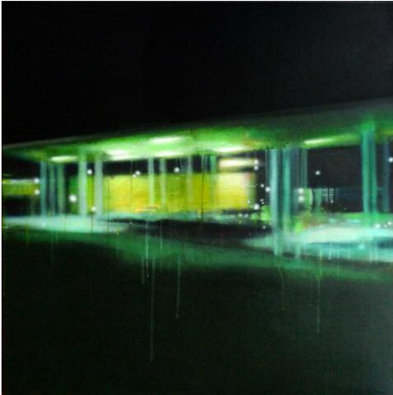
Someone Told Me , juillet 2014 Acrylique sur toile, 80 x 80 cm