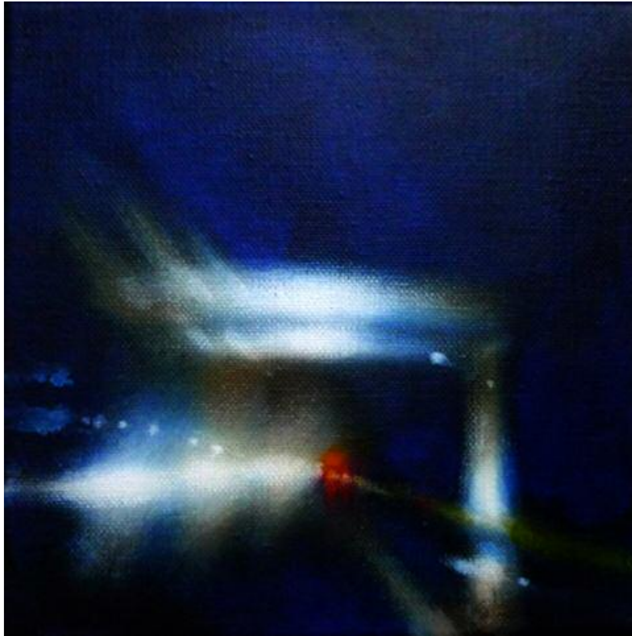
Laëtitia Giraud peinture figurative contemporaine