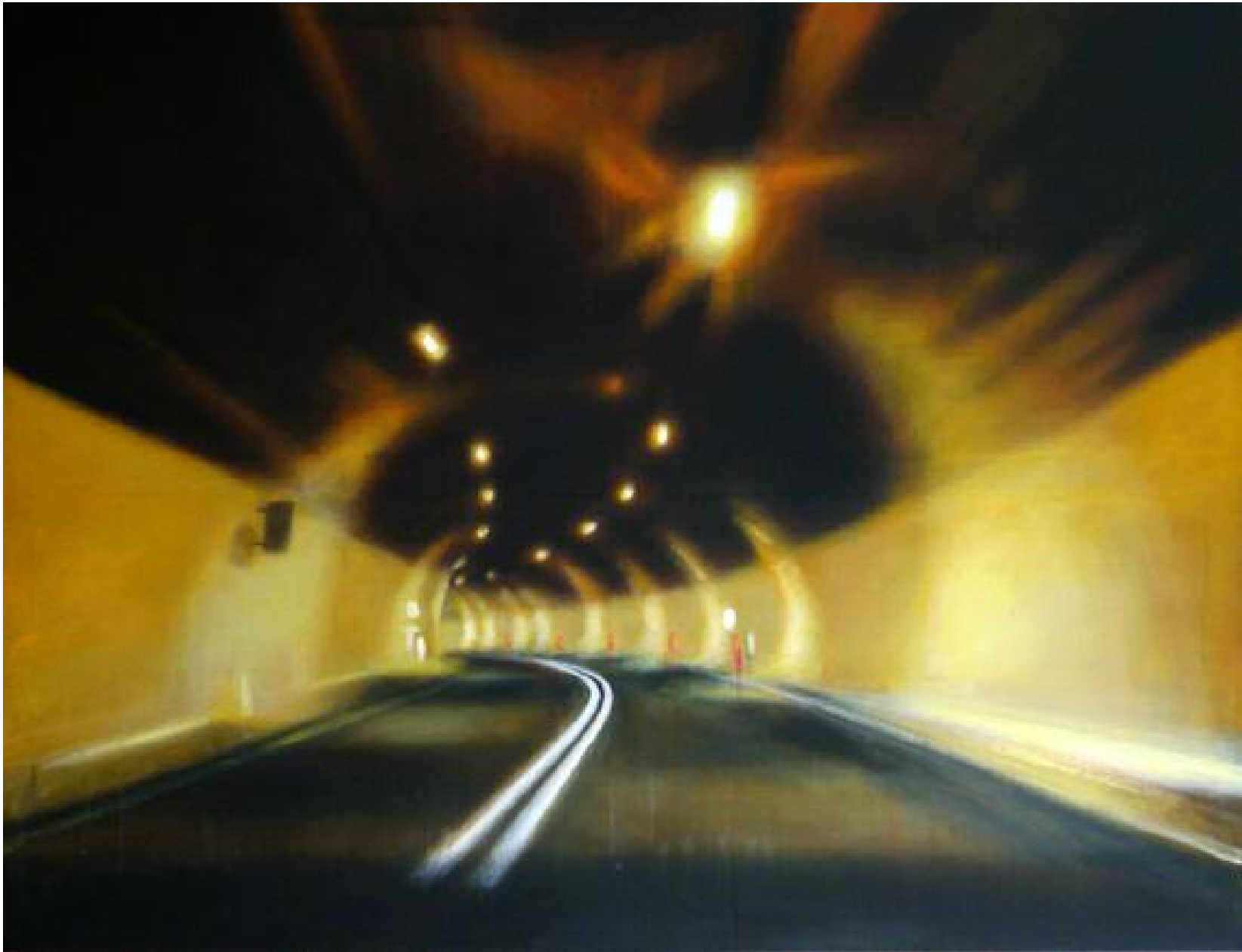
Live Long, septembre 2015 Acrylique sur toile, 89 x 116 cm