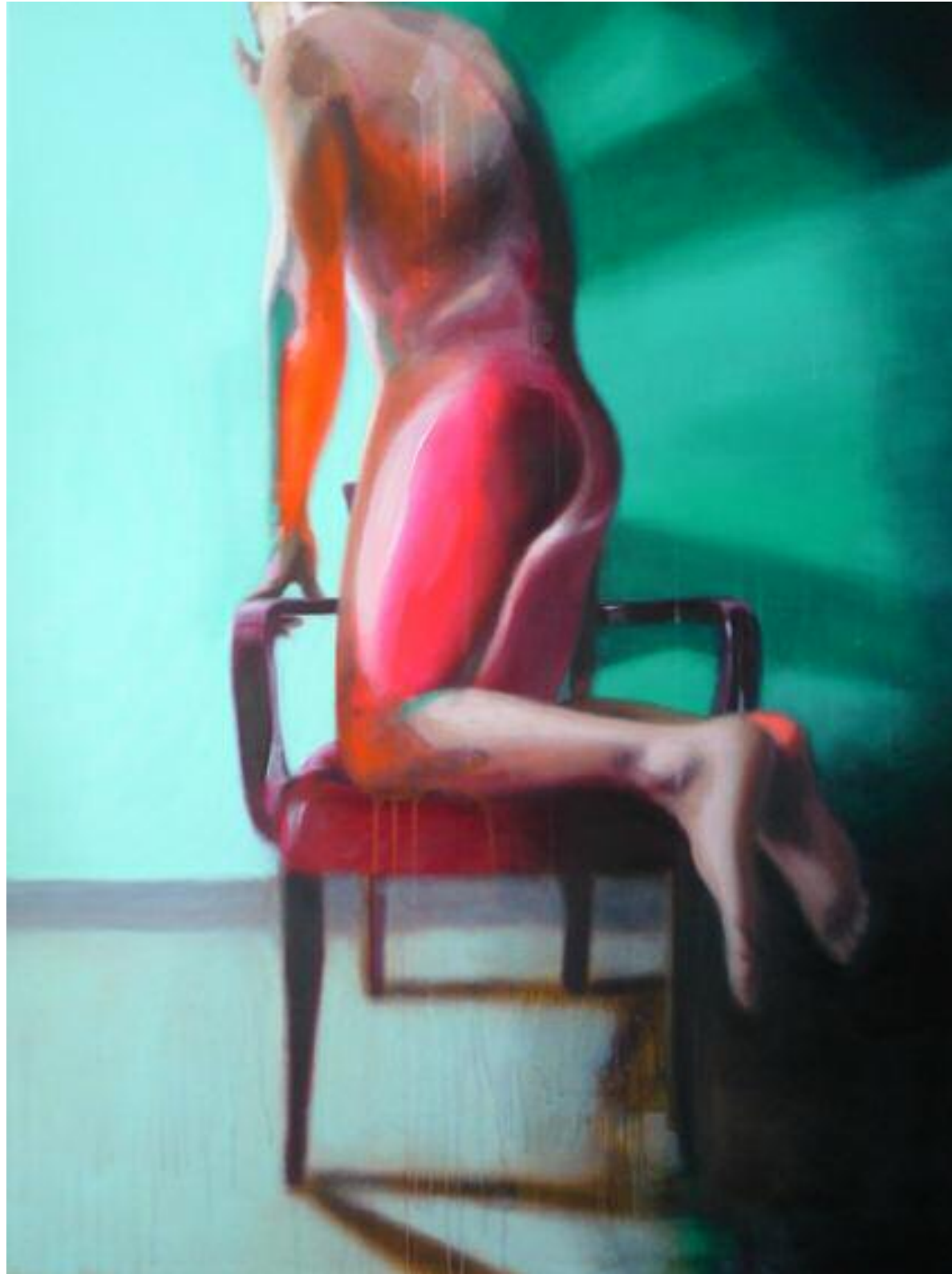
Return To Sender, mars 2015 Acrylique sur toile, 116 x 89 cm