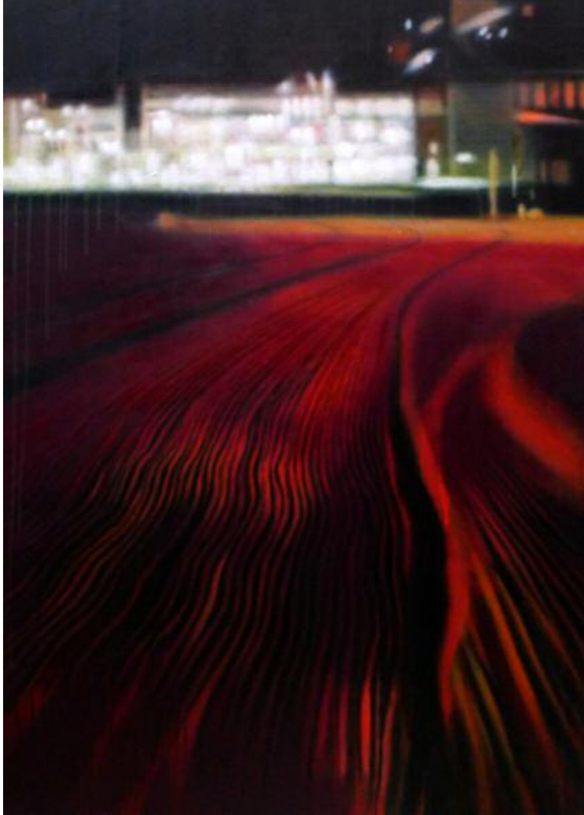
Across The Lines , août 2014 Acrylique sur toile, 116 x 80 cm