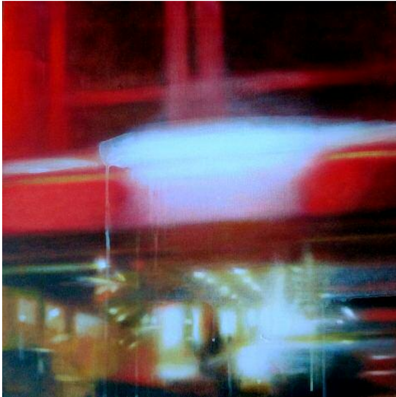
Titanium , février 2015 Acrylique sur toile, 50 x 50 cm