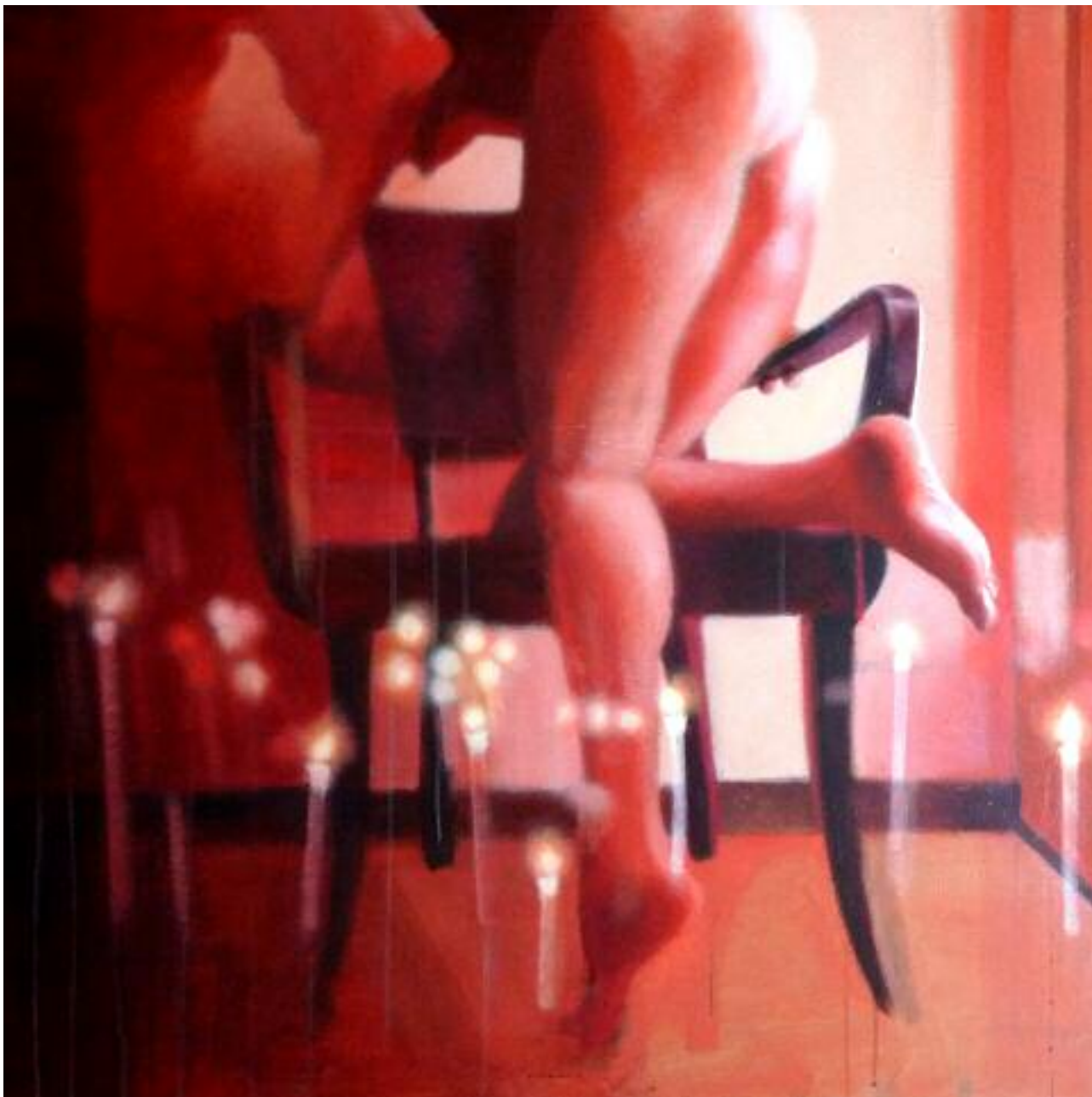
Light My Fire , mai 2013 Acrylique sur toile, 100 x 100 cm