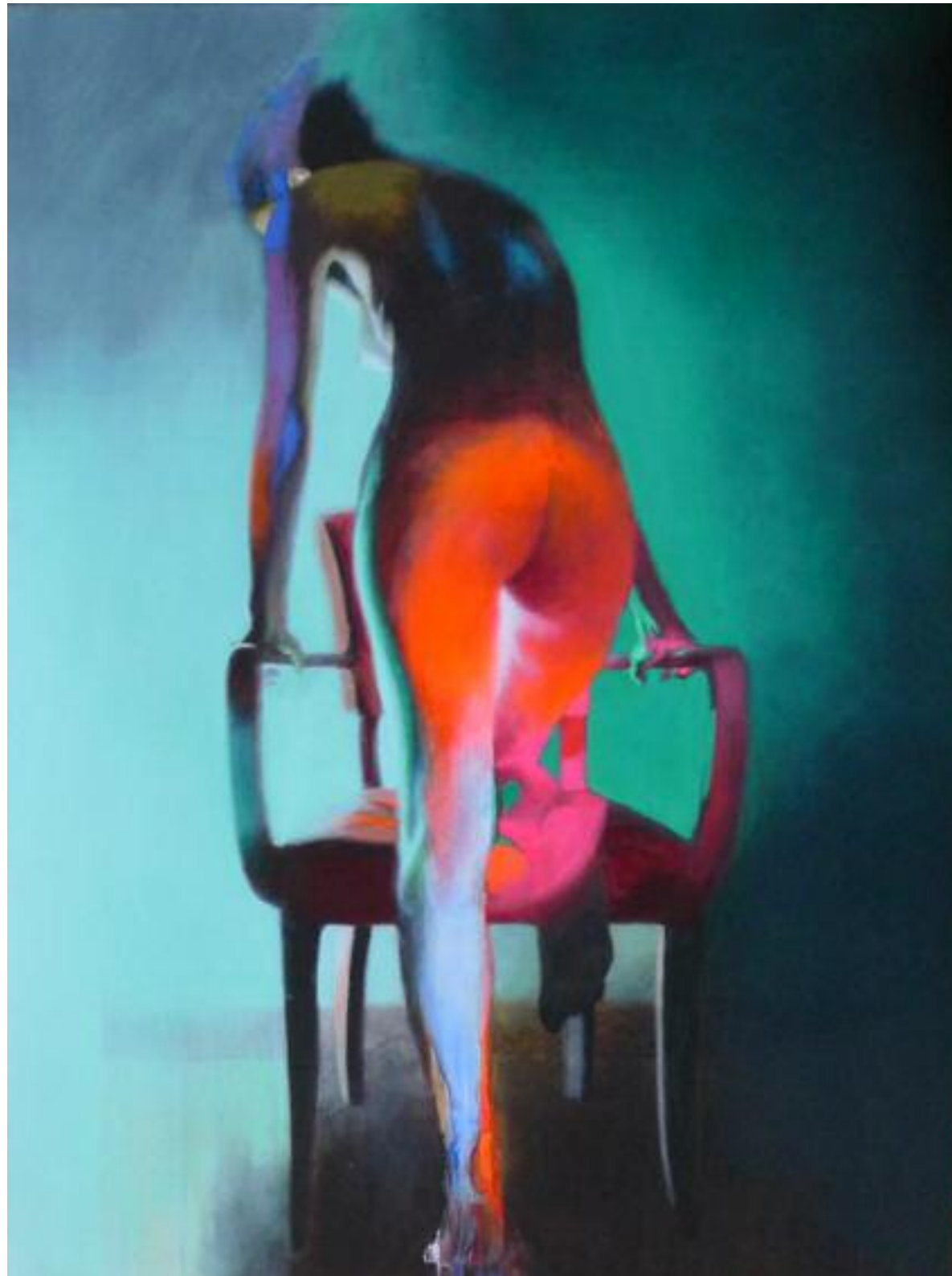
All Shook Up, février 2015 Acrylique sur toile, 120 x 90 cm