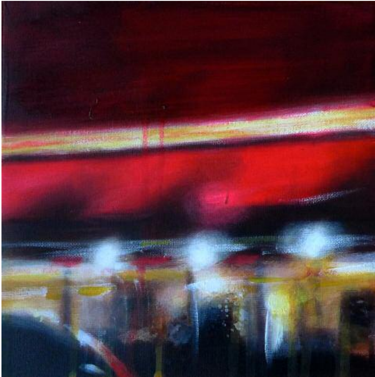
Blurred Lines , février 2015 Acrylique sur toile, 20 x 20 cm