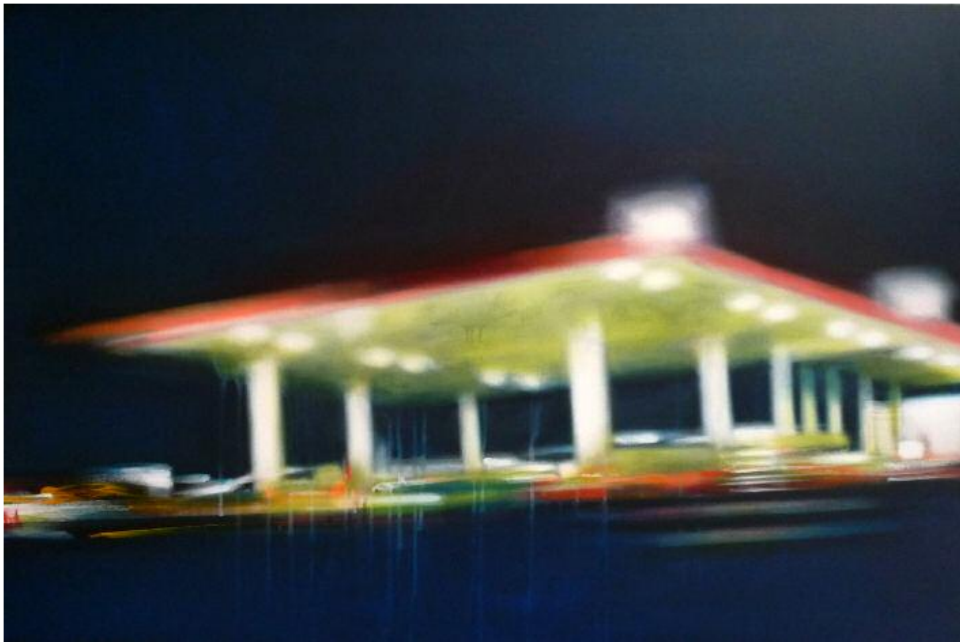
Digital Versicolor, septembre 2014 Acrylique sur toile, 80 x 120 cm