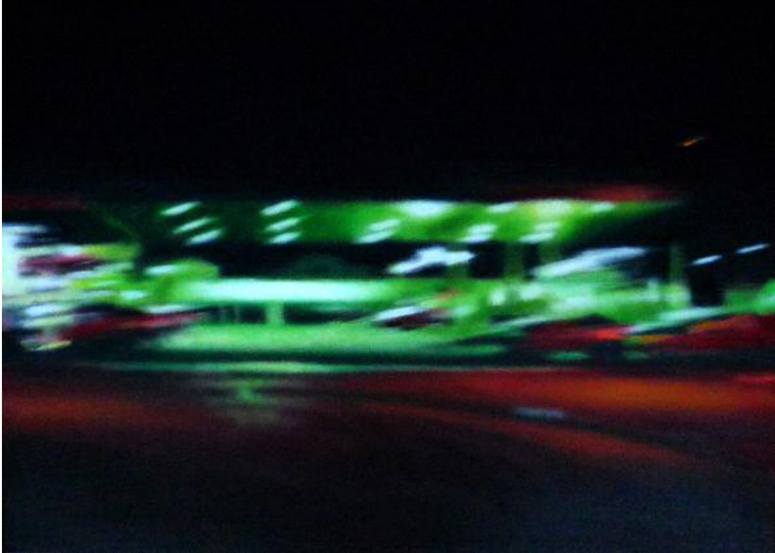
Everything's Gone Green , octobre 2015 Acrylique sur toile, 50 x 70 cm