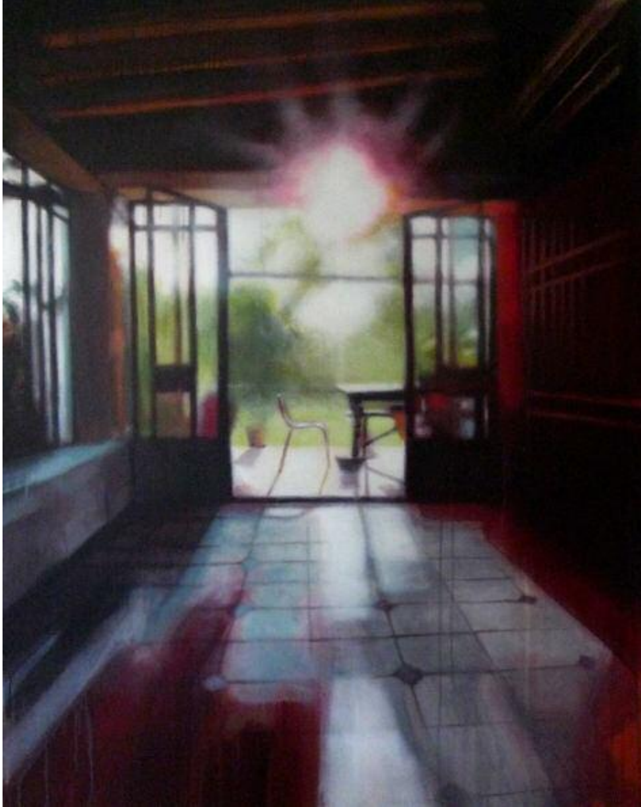
Fade Out Lines , février 2015 Acrylique sur toile, 150 x 115 cm